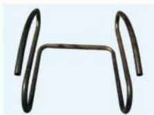
可指定應用工件 Optional Application

Suitable Industries: Car Frame, Car Seat, Handle Bar, Exercise Equipment, Tubular Furniture, Architecture, Aircraft, Exhaust Pipes