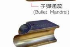
子彈通蕊 (Bullet Mandrel)