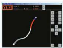
3D 模擬工件 3D Simulation