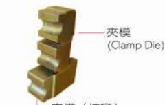
夾模 (拉彎) (Clamp Die/Draw Bending)