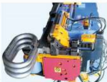
可指定正反轉模車頭 Optional Bending Die Reverse Rotation